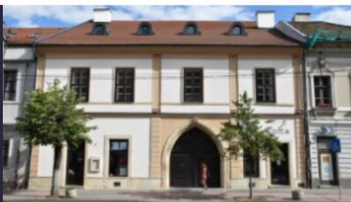
House of Religious Freedom