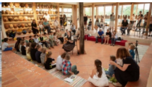
Piscu School Museum and Workshop